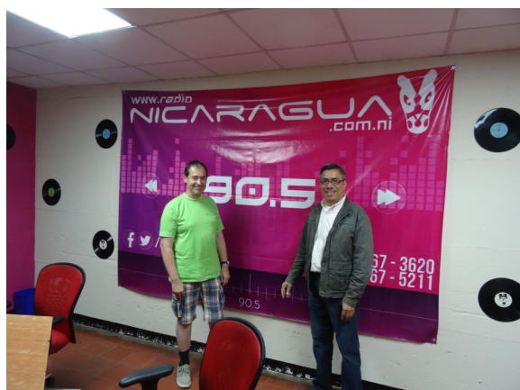
(Bericht und Fotos Harald Süss)

Der Herr Direktor ist schon ca 8 Jahre bei Radio Nicaragua, und hat vorher bei dem religiösen Sender Radio Catolica (auf 720 kHz) als Programmleiter gearbeitet. Er war so nett und zeigte uns auch sein bescheidenes Reich. Studios und Sekretariat waren zum besichtigen angesagt. Technisch nicht reich bestückt, aber offenbar mit viel Fleiss und guten Mitarbeitern wird daraus ein anständiges Programm gemacht.